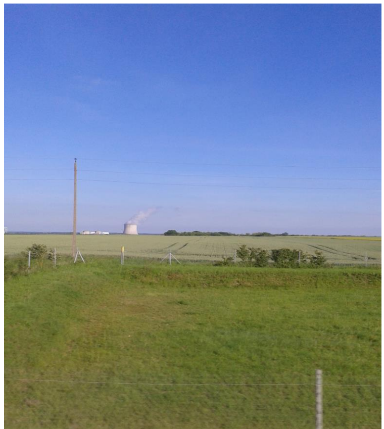
Elektrownia Atomowa widziana z okien autokaru.